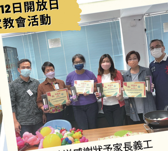
致送感謝狀予家長義工