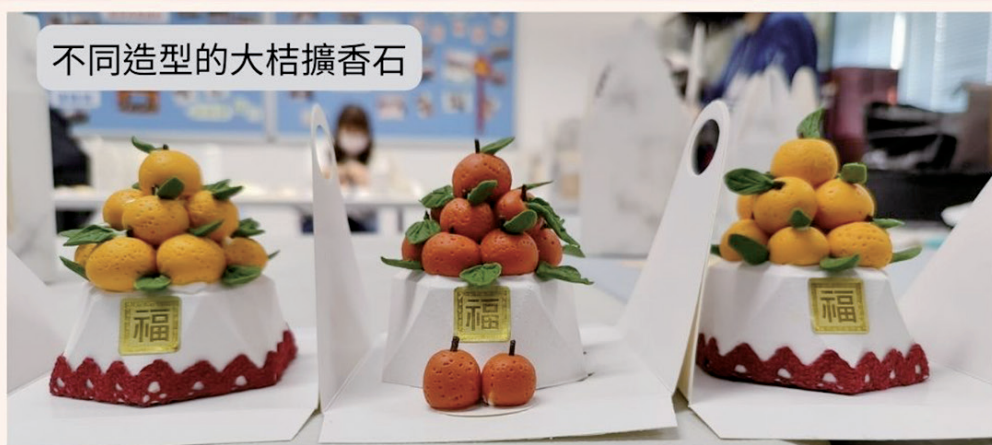
不同造型的大桔擴香石