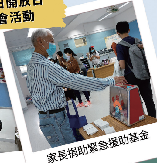
家長捐助緊急援助基金