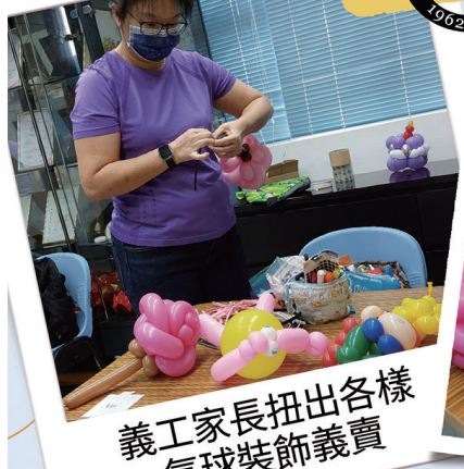
義工家長扭出各樣 氣球裝飾義賣