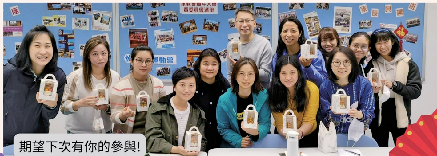
期望下次有你的參與!