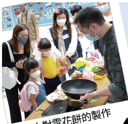
各人對雪花餅的製作 很感興趣