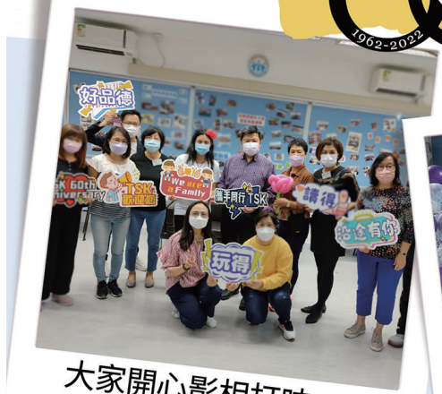
大家開心影相打咭