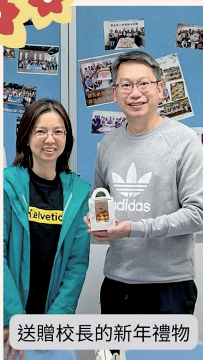
送贈校長的新年禮物