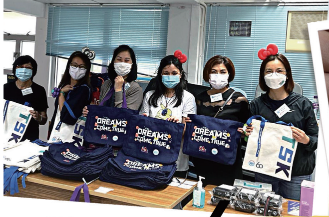
60周年限量版 精品義賣